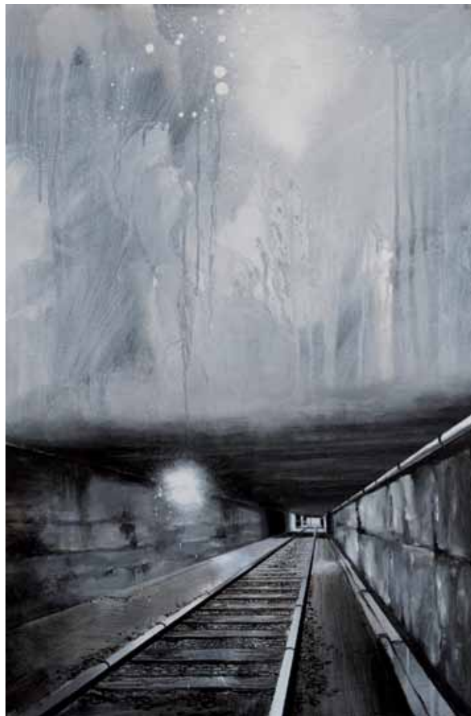
My secret place 2019 Aérosol, acrylique sur toile 61 x 143 cm