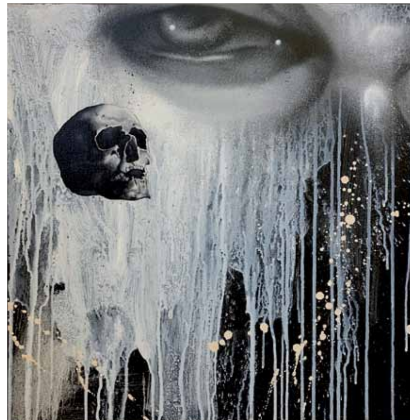
Untold stories 2016 Huile, acrylique, aérosol sur toile 60 x 60 cm