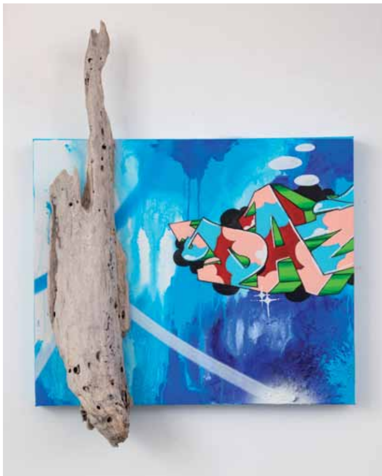
Inside the Blues 2019 Acrylique, aérosol sur toile et bois flotté 61 x 80 cm