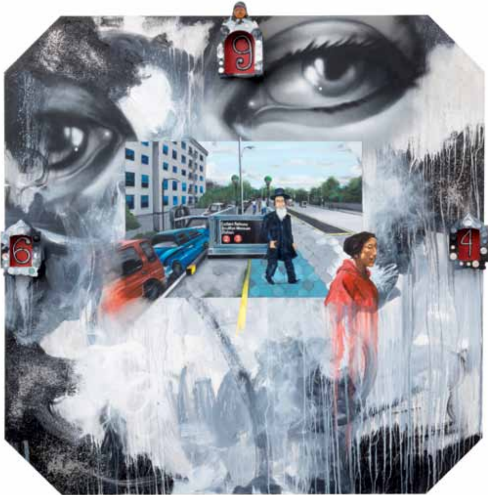
Eastern parkway 2016 Museum of New York city