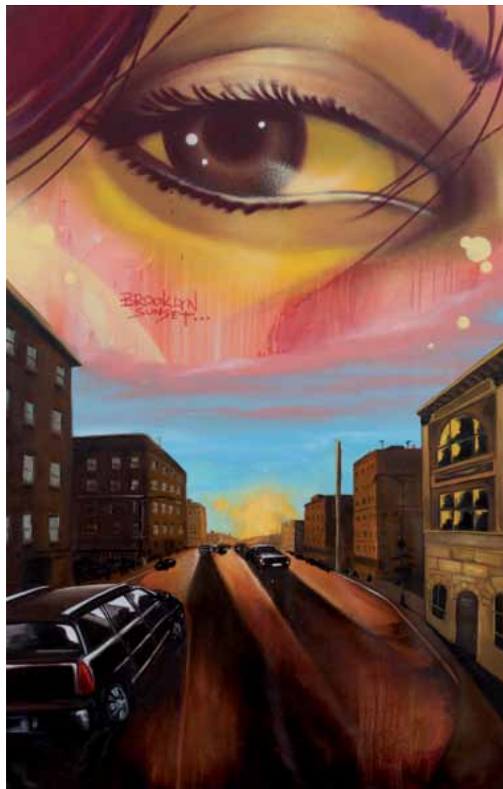
Brooklyn sunset 2019 Huile, acrylique, aérosol sur toile 95 x 146 cm