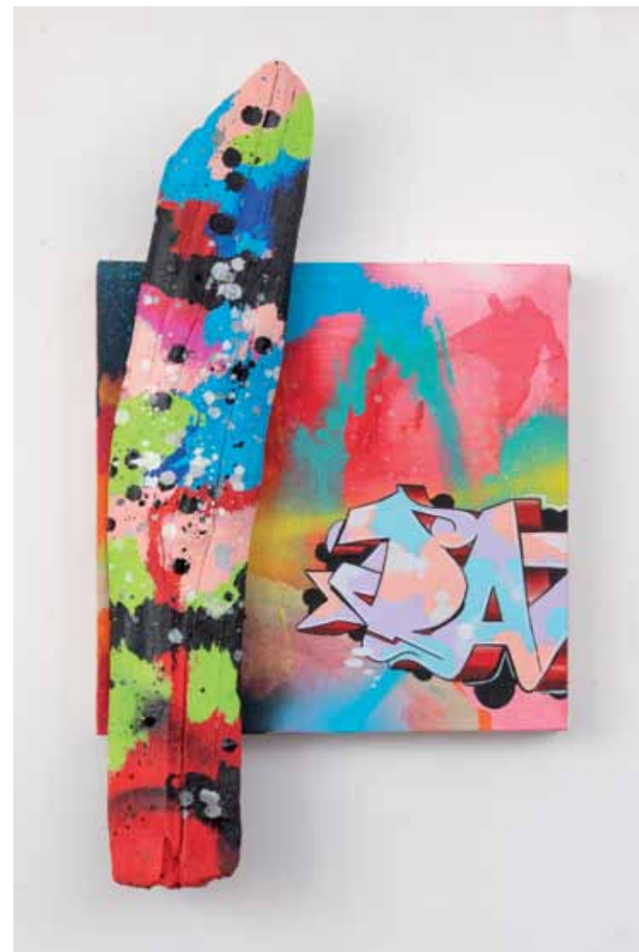
Spoiler Alert 2019 Acrylique, aérosol, bois flotté sur toile 43 x 72 cm