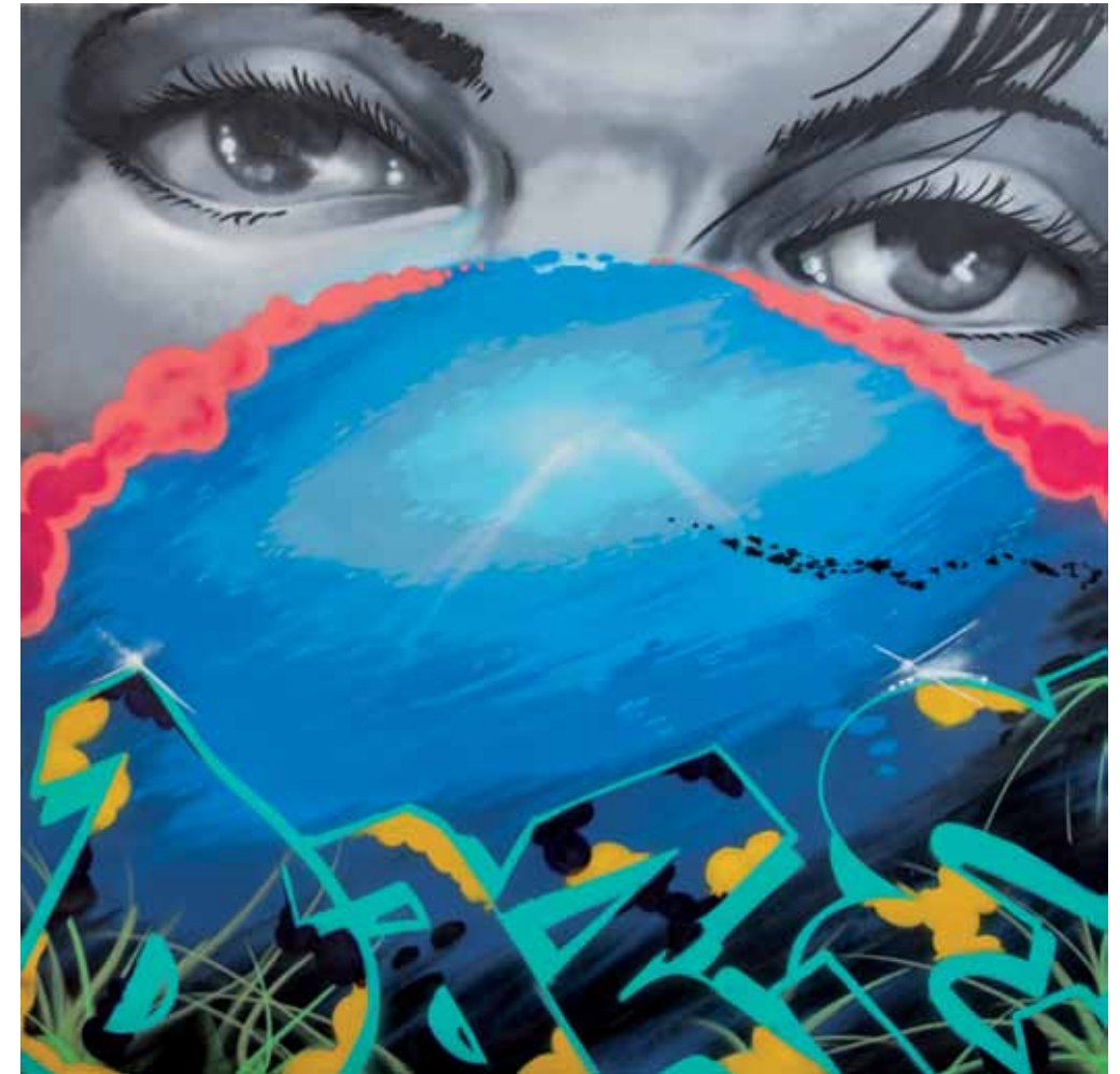
Undersea Dream - 2018 Aérosol sur toile, 210 x 210 cm

Mais Daze ne se limite pas à ce registre figuratif. Sur les deux toiles intitulées « Spoiler Alert » et « Inside the Blues » nous découvrons un tout autre travail porté vers l'abstraction. La signature, ce par quoi tout commence dans le monde du graffiti, y joue un rôle majeur. L'artiste l'a traitée dans le dynamisme viril qu'on lui connaît. « Tag éternel » absolument maîtrisé il s'échappe en partie du cadre affirmant ainsi l'esprit de liberté qui est le sien. À cet élément fort symbolique en est associé un autre