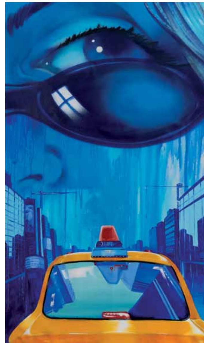
Taxi ride 2019 Aérosol, acrylique, huile sur toile 90 x 150 cm