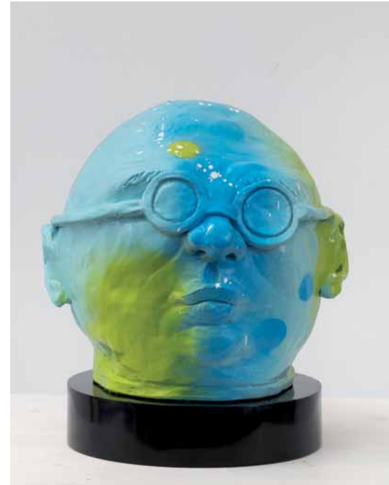
Big Boss Head 2018 Aérosol, Acrylique sur résine