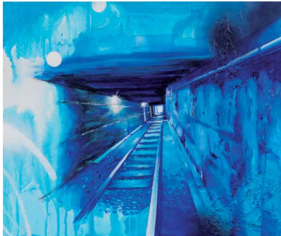
Untitled 2019 Acrylique sur toile, 51 x 61 cm