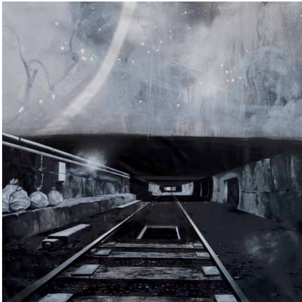
Don't go that way, go this way 2019 Acrylique, aérosol sur toile 136 x 136 cm