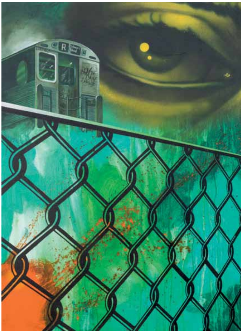
Chain link Dream 2 2017 Huile, acrylique, aérosol sur toile, 102 x 128 cm